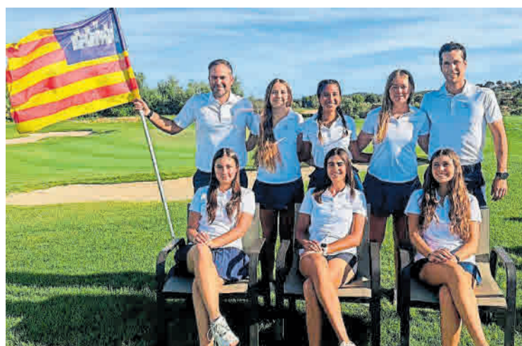
Componentes del equipo Absoluto Femenino.

Tras las dos jornadas de stroke play, Baleares firmó la decimocuarta plaza de las dieciséis federaciones participantes. El registro situó al equipo en el segundo flight, el que agrupa a las clasificadas entre los puestos 9º y 16º.