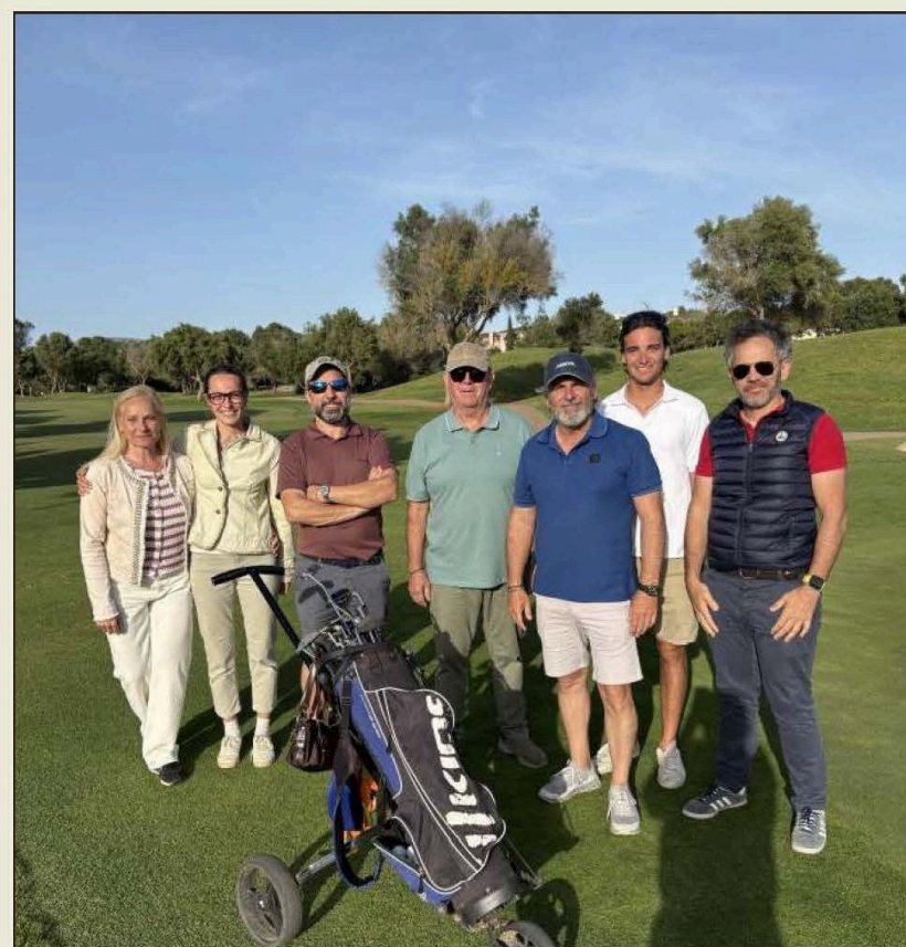
Alumnos asistentes a los cursos de iniciación.

La campaña entra ahora en su fase final, y la Federación recuerda que el plazo de inscripción finaliza el próximo 6 de mayo. Por un coste de 59 euros, los participantes pueden acceder a formación